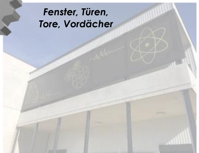
Fenster, Türen, Tore, Vordächer