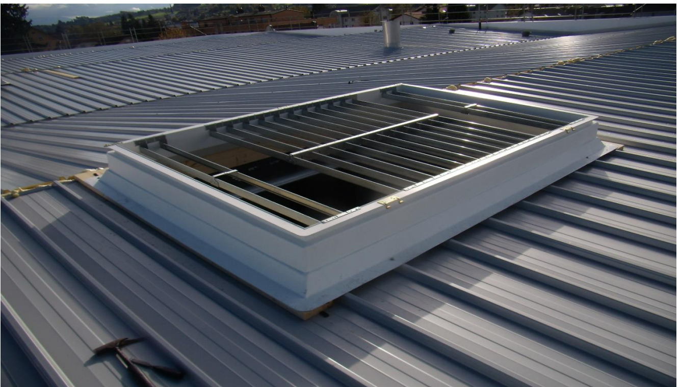
Dach in Sandwichpaneelen