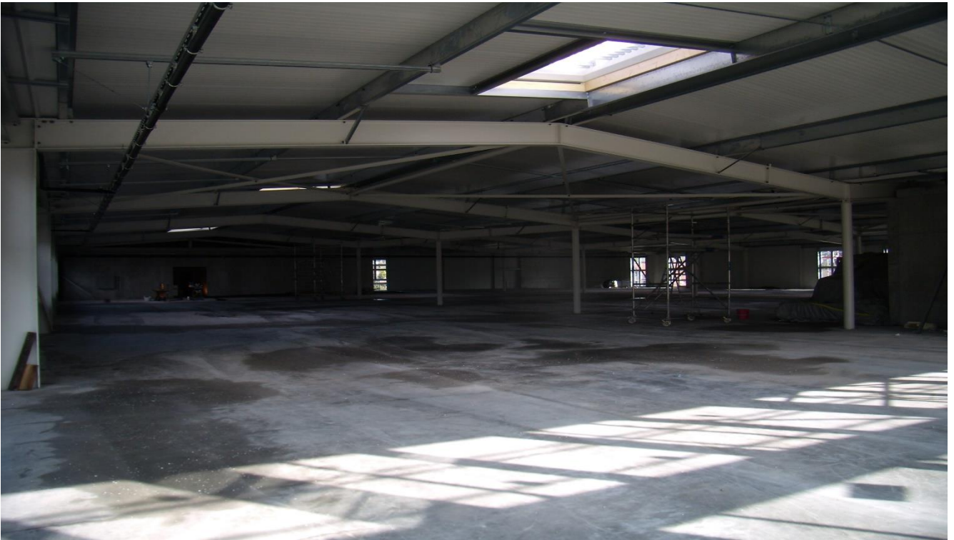
Rahmenbinder mit Kipphalterungen