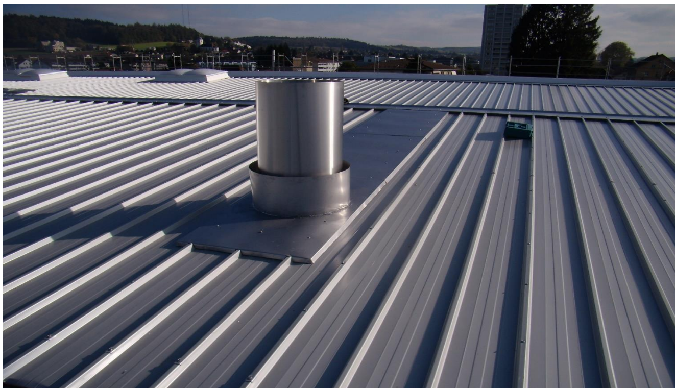
Schleppblech in CNS für Dachdurchdringung