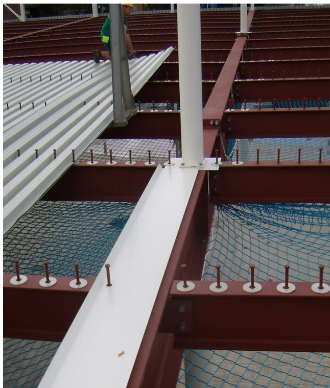
Abdichtung der Kopfbolzendübel