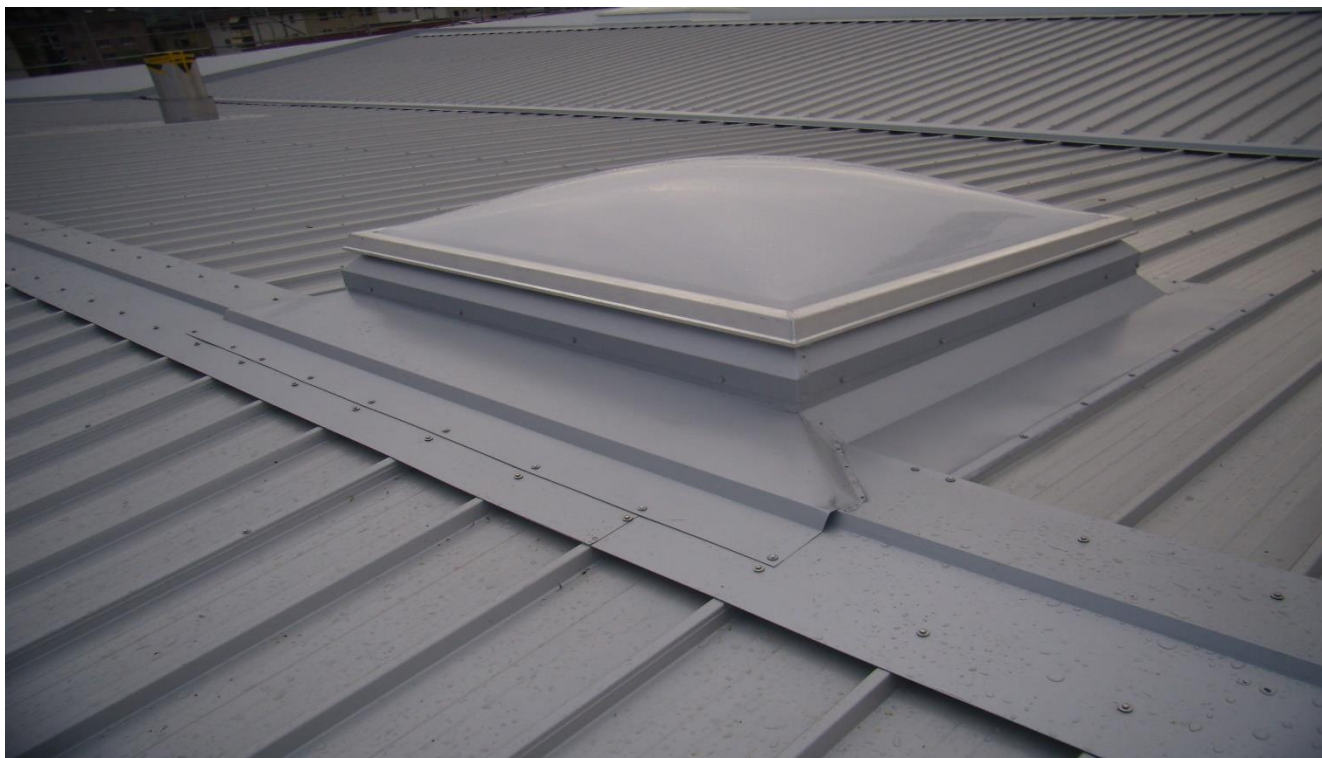
Oblichter mit RWA