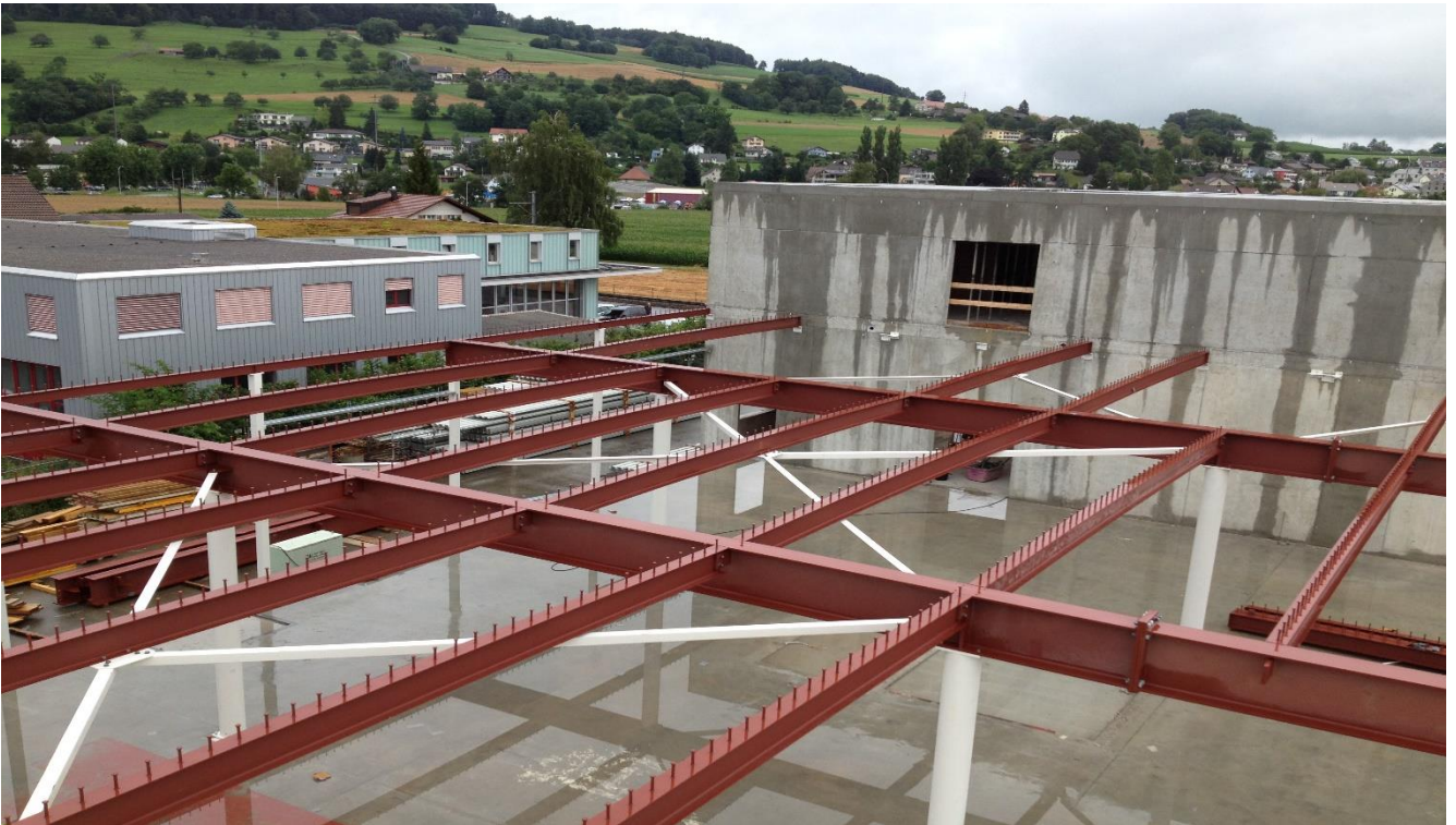
Kopfbolzendübel für Verbunddecke