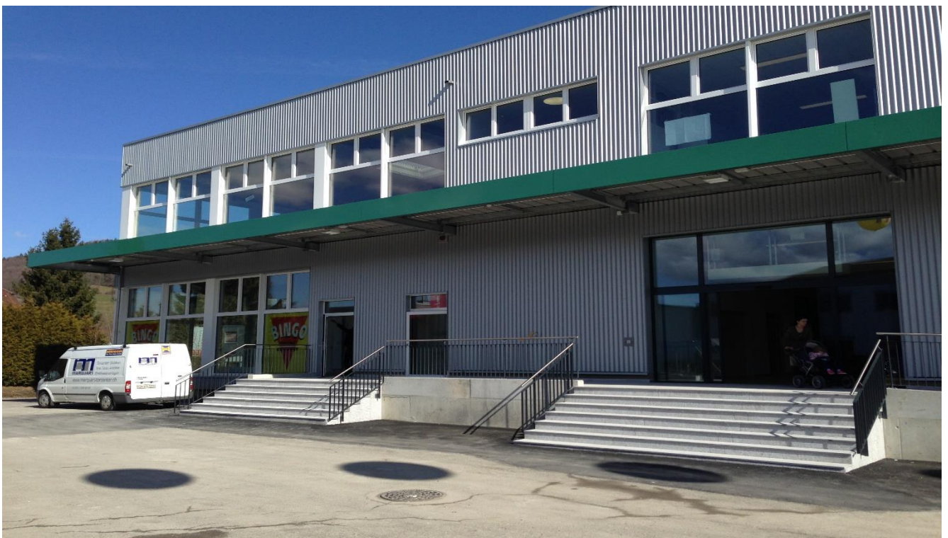
Vordach mit Blende