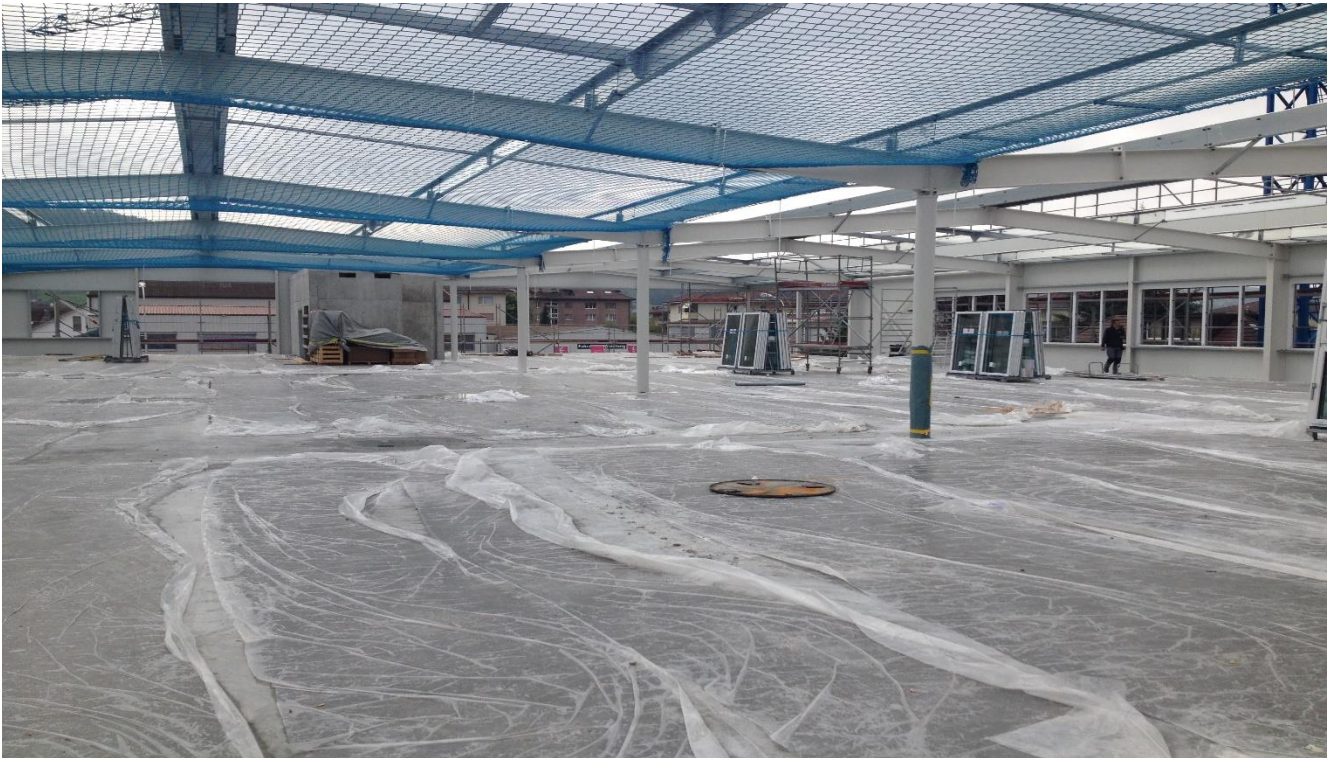
Oberes Stockwerk betoniert