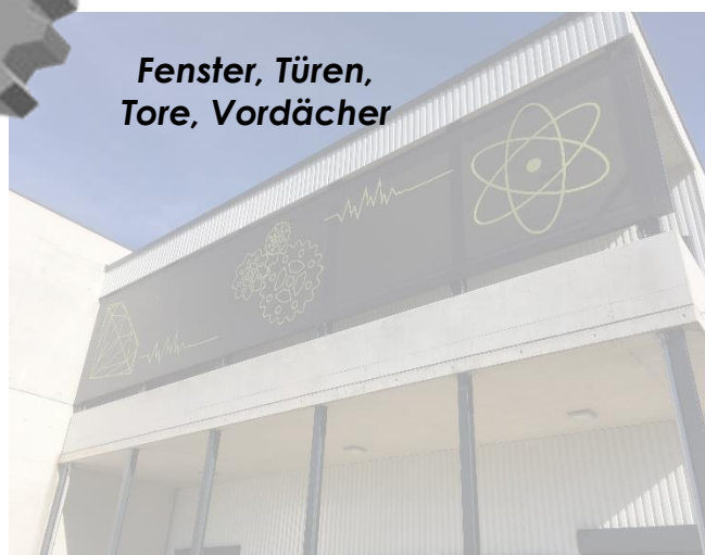
Fenster, Türen, Tore, Vordächer