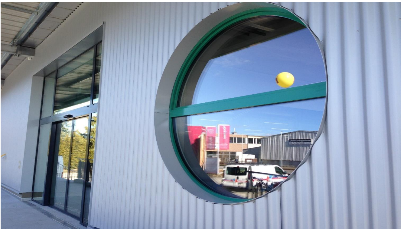
Eye Catcher beim Haupteingang